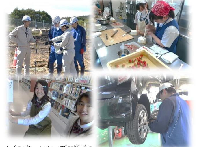
&lt;インターンシップの様子&gt;

さらに、1年次生も希望者が期末考査後から放課後講習に参加しています。進路選択を遠い将来のことと思わず、計画的に実力を養成するよう指導していきます